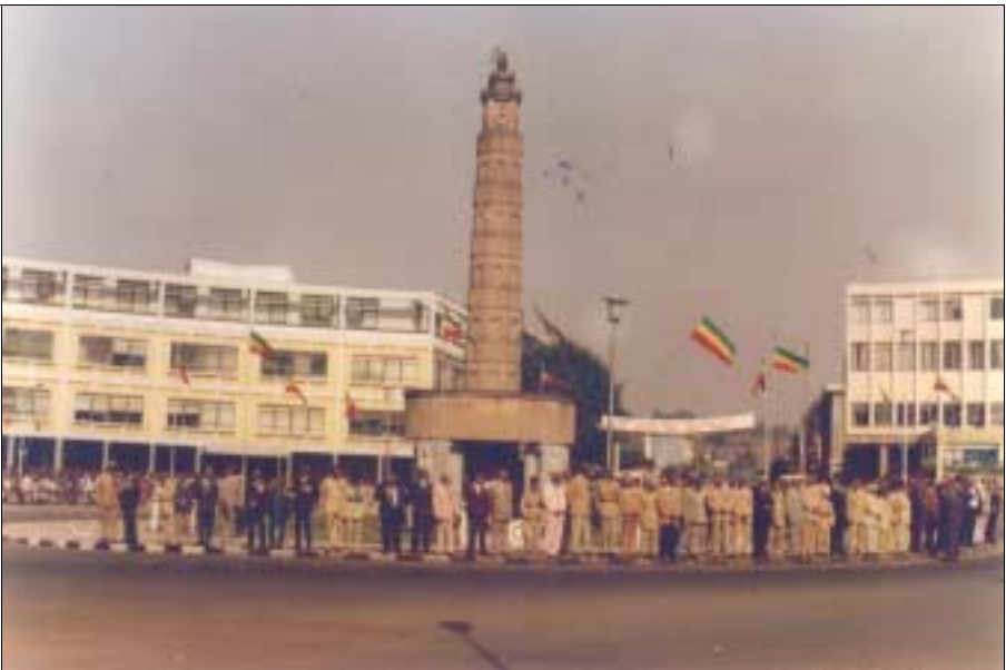
አዲስ አበባ፣ ኢትዮጵያ በሚያዝያ ፳፯ የነፃነት ሐውልት አደባባይ የተነሣነው ምስል።